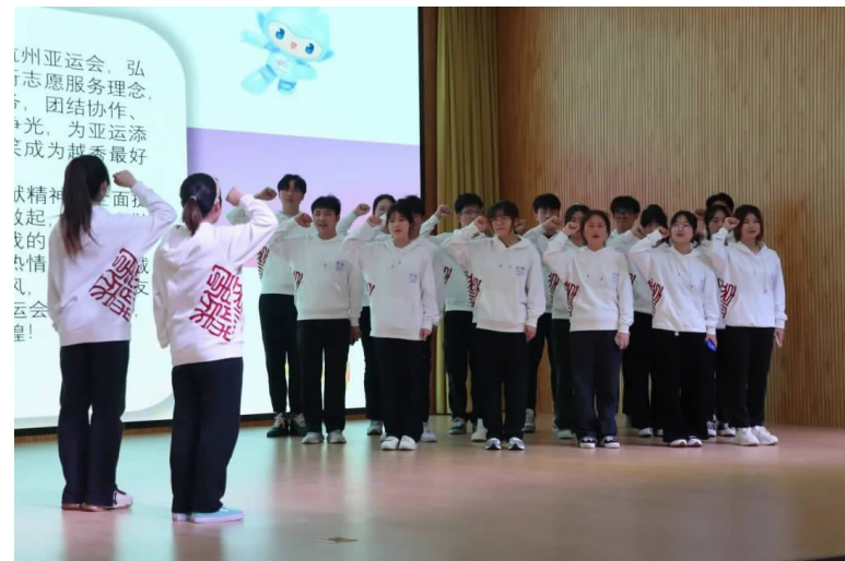
志愿者代表们上台宣誓