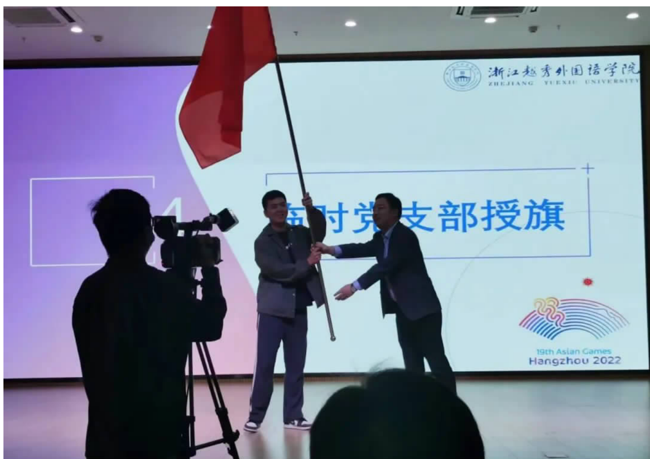
志愿者临时党支部成立授旗

今年既是建团100周年，也是党的二十大召开的重要之际。越秀小青荷中也有一批党员先锋，今天我们在这里隆重授旗，让这批优秀青年大学生积极奉献，发挥党员先锋作用。接过旗帜后，我们接过的是光荣，接过的是使命，也接过了我们对志愿者事业的追求和热爱。