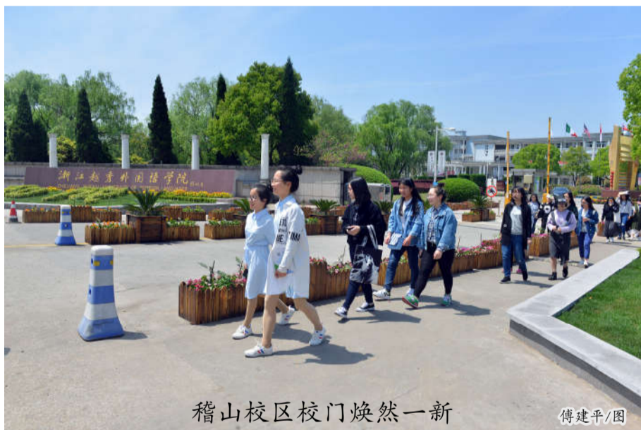
稽山校区校门焕然一新