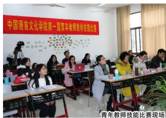
青年教师技能比赛现场