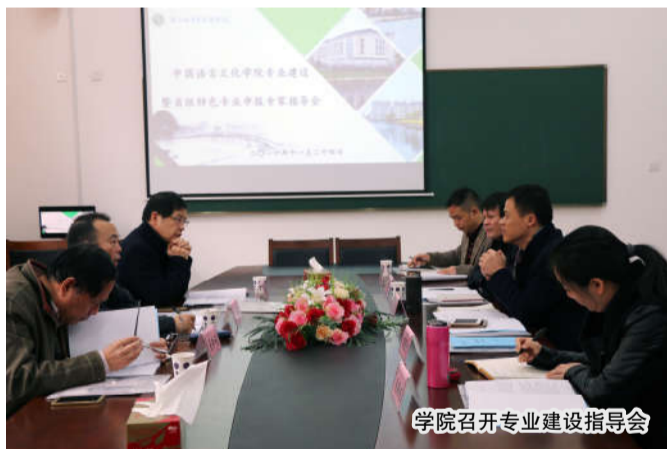
学院召开专业建设指导会

二是通过教学研究不断提升教师的教学研究能力，促进课堂教学质量的进一步提升。教师共出版教材 8 部，校级立项教材 4 部；获得省级教改项目 1 项、市级 3 项、校级 11 项；获得校级教学成果奖一、二等奖 3 项；公开发表教学研究论文 30 余篇。