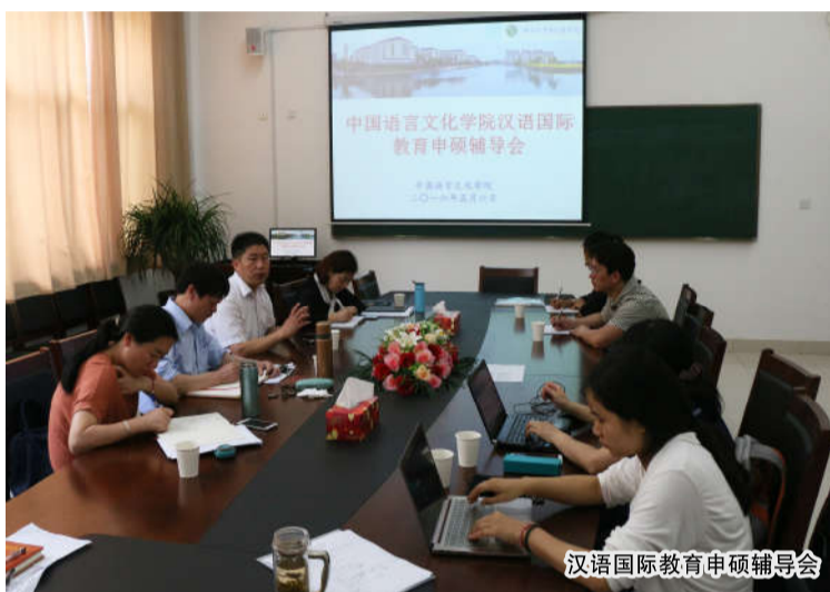
汉语国际教育申硕辅导会

哲学社会科学规划学科组专家 1 人、省高校中青年学科带头人 2 人、省级“151 人才工程”1 人、省级优秀教师 2 人、省之江青年社科学者 1 人、省级劳动模范 1 人、省教坛新秀 1 人、博士生导师 3 人、硕士生导师 6 人。