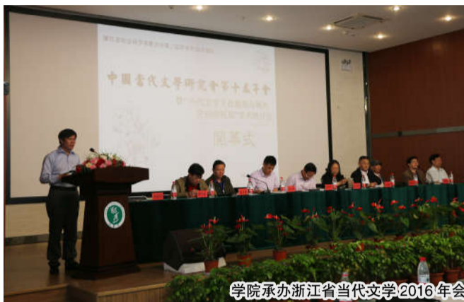
学院承办浙江省当代文学 2016 年会