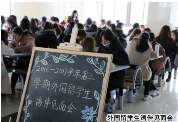
外国留学生语伴见面会

我校留学生人数从 2005 年的个位数上升至 2016 年的来自五大洲 27 个国家的 300 多名留学生，连续三年在省其他本科院校（硕博授予院校除外）国际化排名中外留学生人数获得第一名。学院开展中国文化体验、“乐享汉语”比赛，注重课堂教育与课外活动相结合，课堂教育与中国传统文化相结合。外国留学生在省“梦行浙江”活动中取得佳绩，“越秀国际义工队”被《浙江日报》、《绍兴日报》等多家媒体报道，被称为绍兴的“洋雷锋”。外国留学生积极参加运动会等校园活动，增添了国际化氛围。学院积极打造中外学生交流平台，以外国留学生语伴等为载体，开展多语种等中外学生交流活动，让中外学生在互助中成长，在交流中成材。