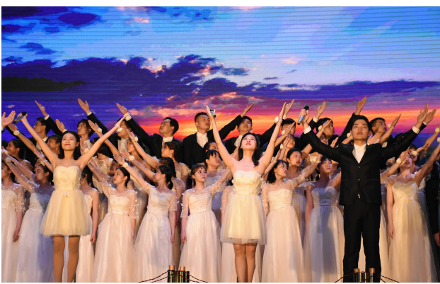
红色的五月,属于热情似火的青年人、属于意气风发的青年人、属于积极向上的青年人。在这个美好的五月举行比赛,意在扩展同学们的阅读范围,提升同学们的人文素养和文化品味,5月3日晚,我校首届中外文经典诗词朗诵比赛在镜湖校区和成广场拉开帷幕。